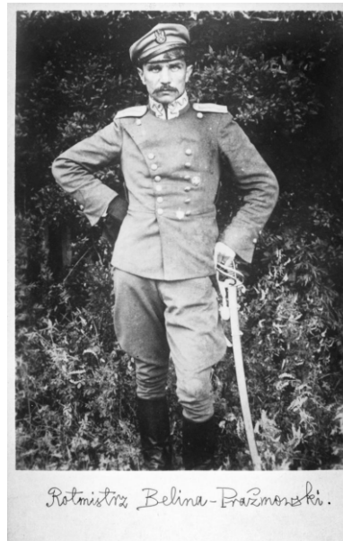
rtm. Władysław Belina Prażmowski