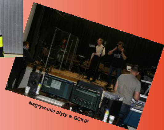
Nagrywanie płyty w GCKiP