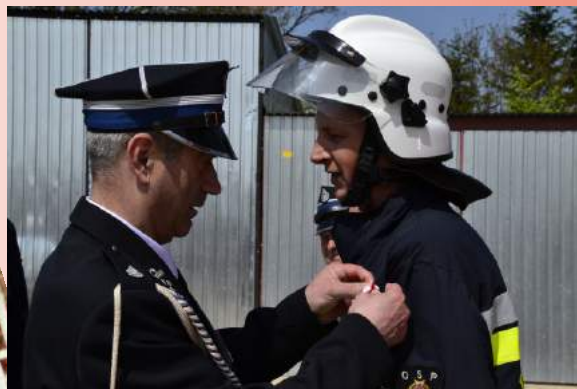
Gminny Dzień Strażaka