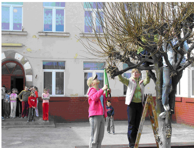
Na zdjęciu: uczniowie klasy szóstej pracują z zaangażowaniem

Wiosna, to pora roku na którą czekamy z utęsknieniem, wszystko budzi się do życia. Kiedy zieleń zaczyna cieszyć oczy, rozpoczyna się czas wiosennych porządków. W ciągu długiej zimy „Król Śmieć” zadomowił się w wielu miejscach. Najwyższy czas aby z „Nim” zrobić porządek. Najwyższy czas aby pozostałości po nie dokończonych porządkach jesiennych, bądź porzucone śmieci przez ludzi, którzy jeszcze teraz nie potrafią dbać o środowisko naturalne – uporządkować.