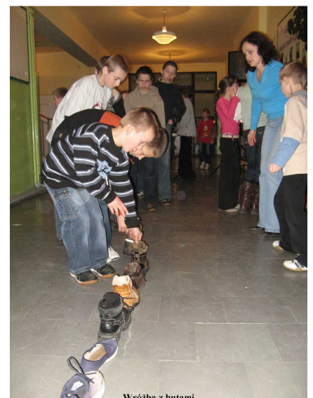
Wróżba z butami

W Szkole Podstawowej w Godziszowie II już od kilku lat bawimy się z dziećmi we wróżenie, aby w ten sposób przybliżyć im tradycję Andrzejek. Było wróżenie z butów, kubeczków pod dowiedzieć się czegoś o swojej przyszłości. którymi ukryto „magiczne” przedmioty, Andrzejkowe wróżby łączą się z serduszek, karteczek z imionami, obierek wierzeniami, według których w tym okresie Na ogół nie traktujemy ich poważnie a z zaświatów przybywają na ziemię duchy. wielu z nas uważa je tylko za zabawę. Są Możemy więc za pośrednictwem wróżb jednak i tacy, którzy twierdzą, że owe zapytać co nas czeka w najbliższym czasie. wróżby czasem się sprawdzają (więc może Podczas, gdy św. Andrzej miał pomóc warto spróbować?).Dla wszystkich jest to