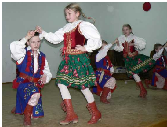
Pokaz tańca ludowego podczas noworocznej choinki