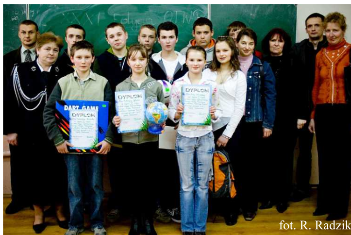
fol. R. Radzik