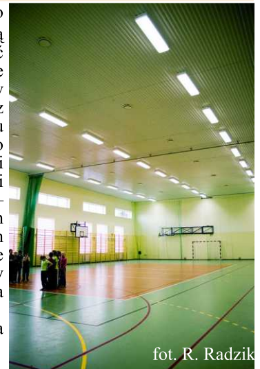
fol. R. Radzik