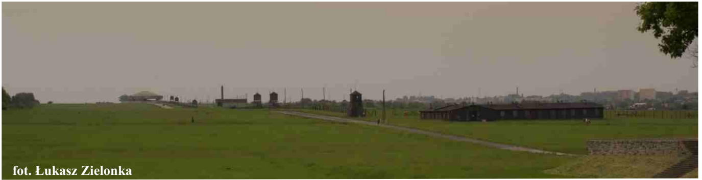
fot. Łukasz Zielonka

7 września 1942r. na plac wiejski (obecnie jest tam prywatna stacja LPG) w Zdziłowicach Niemcy spędzili mieszkańców i wybrali ok. 130 mężczyzn, których to załadowali do samochodów i wywieźli na 8 dni pobytu do Lublina na Majdanek. Po drodze uciekło pięciu.