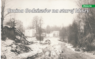
Widok na Urząd Gminy od kierunku Brzezi