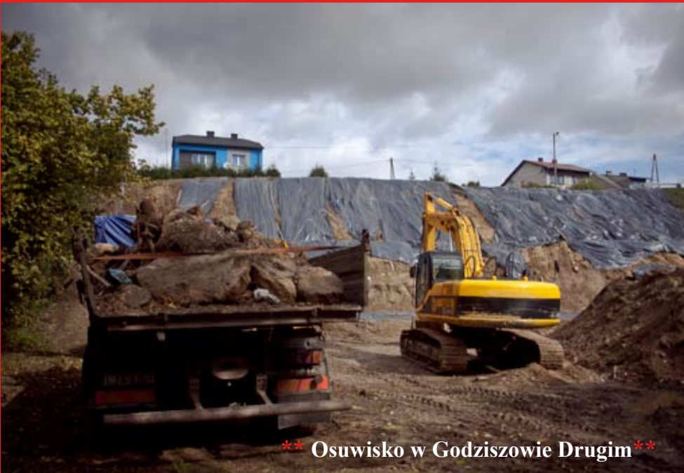
** Osuwisko w Godziszowie Drugim **

Przy pomocy środków budżetu państwa wykonane zostaną w tym roku prace na dwóch wąwozach (Godziszów Pierwszy i Zdziłowice Czwarte) oraz nowe asfaltowe nawierzchnie pojawią się w Andrzejowie oraz w kierunku Kolonii Godziszów Drugi. Również dzięki tym samym środkom zabezpieczona zostanie osuwisko w Godziszowie Drugim. Szerzej o robotach będziemy informowali po zakończeniu zadań.