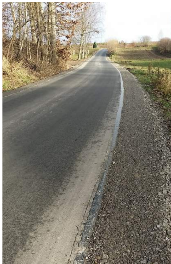
Godziszów Pierwszy-kolonia, foto Łukasz Zielonka