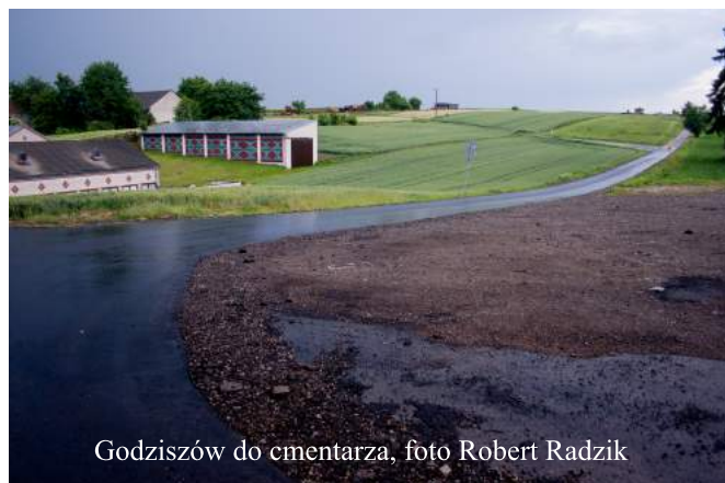
Godziszów do ementarza

Zadanie obejmowało renowację rowów odwodnieniowych, przebudowę części chodników oraz utworzenie dwóch zatoczek autobusowych. Przy szkole, w miejscu dla pieszych, ustawiono światła pulsacyjne.