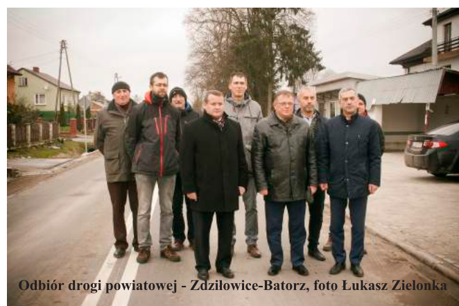
Odbiór drogi powiatowej - Zdziłowice-Batorz

23 października 2017 roku odbył się w Godziszowie odbiór zadania, w którym uczestniczyli przedstawiciele stron uczestniczących w kontrakcie.