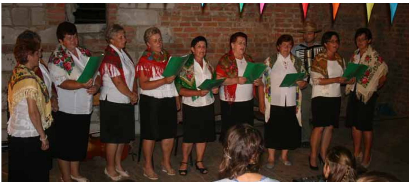
Zespół śpiewaczy „Piłatka” podczas festiwalu „Na rozstajnych drogach” w Zdziłowicach.