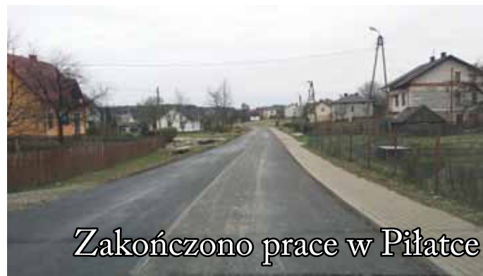
Zakończono prace w Piłatce

15 września 2016 roku przedstawiciele powiatu janowskiego złożyli wnioski o dofinansowanie w przyszłym roku zadań na drogach powiatowych z programu tzw. schetynówek. Jeden z wniosków dotyczy drogi w Zdziłowicach Drugich.