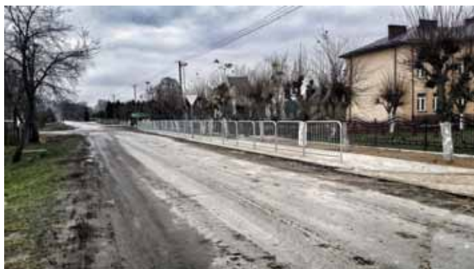
Zabezpieczenie z barier przy Zespole Szkół w Zdziłowicach