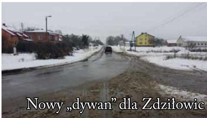
Nowy „dywan” dla Zdziłowic