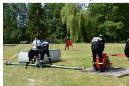
3. zbudowanie linii głównej z dwóch odcinków W-75,