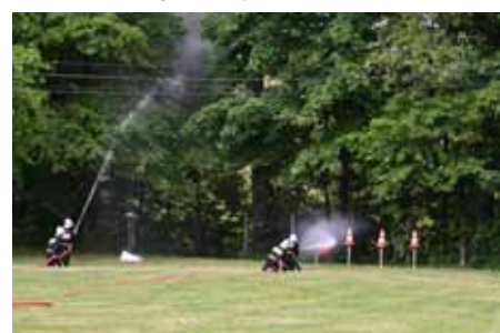
7. przewrócenie pachołków, lub obrócenie tarczy prądem wody.