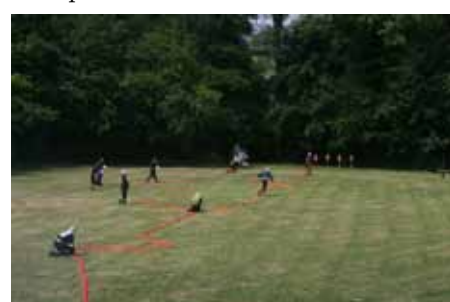
5. ruchomienie motopompy i zassanie wody,