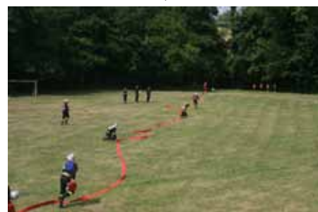
4. zbudowanie dwóch linii gaśniczych (po 2 odcinki W-52 każda),