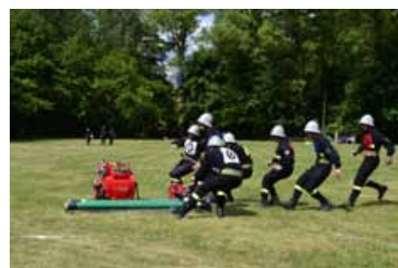
2. zbudowanie linii ssawnej,

Konkurencja ćwiczenie bojowe obejmuje: 1. dobiegnięcie do miejsca ułożenia sprzętu (podestu),